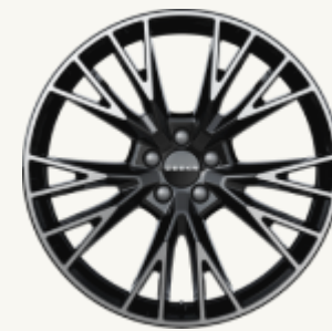
X Flagship R20" Forjado multi-radio, acabado bitono