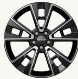
X Premium R19" Cinco radios dobles, acabado bitono