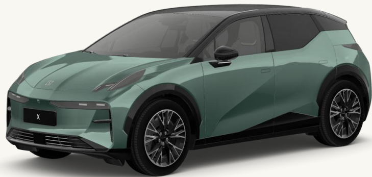
X Verde Pino