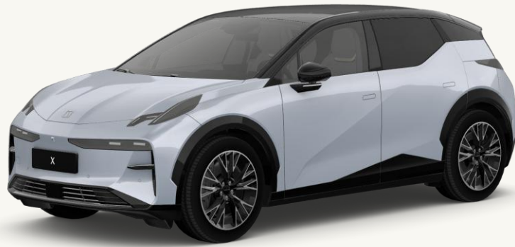
X Gris Neblina