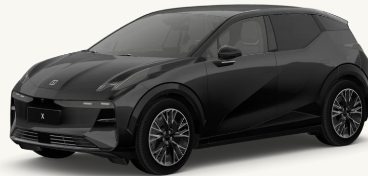
X Negro Phantom Bajo pedido, únicamente en Flagship