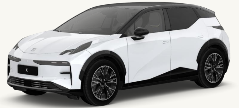
X Blanco Cristal