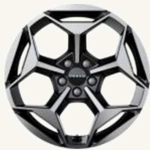
X Sport R18" Cinco radios, acabado bitono