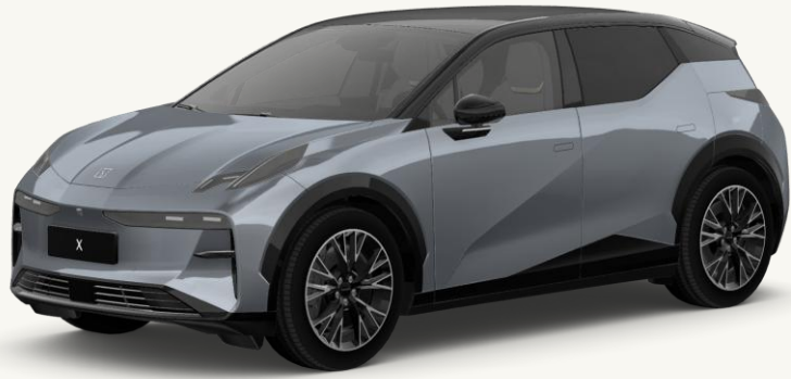
X Gris Metal